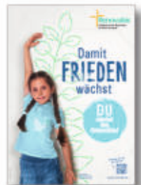
Illustration: © Renovabis/Maria Margret Bauer

LIGA Bank eG IBAN DE24 7509 0300 0002 2117 77 Pax-Bank eG IBAN DE17 3706 0193 3008 8880 18